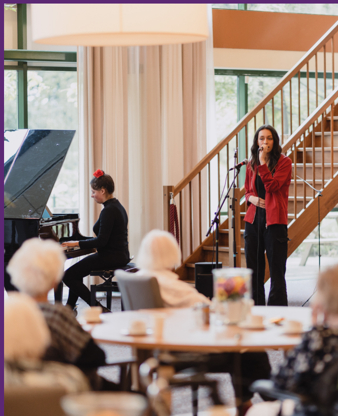
Beeld: Optreden Trias Talent Agency met het project Rijswijk in Verbinding

Ondanks dat er minder animo was voor de online lessen hebben in totaal 132 cursisten tussen de 7 t/m 12 jaar de muzieklessen op de Wijkmuziekschool Leidschendam-Voorburg gevolgd. Van dat aantal hebben sommige cursisten aan meerdere blokken meegedaan. De meeste leerlingen zitten op een Brede school in Leidschendam-Voorburg, waardoor ze kosteloos muziekles kunnen volgen.