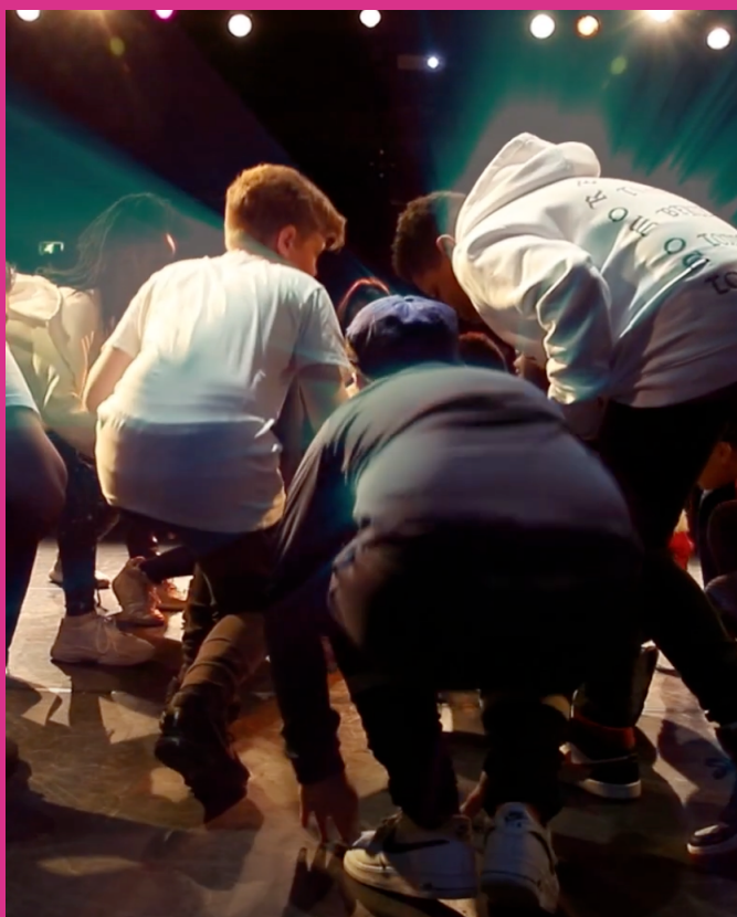
Beeld: Kinderen namen deel aan het Rijswijks Songfestival

Eind juni 2021 organiseerde Trias een online webinar met wetenschapsjournalist Mark Mieras. In dit atelier gaf Mark Mieras een lezing over de rol en bijdrage die cultuureducatie biedt in verschillende stadia van het menselijk leven. Deelnemers hadden een actieve rol in de lezing en er was ruimte voor een groepsgesprek. De sessie is breed gedeeld onder het netwerk van de Trias en bezocht door vertegenwoordigers van allerlei culturele instellingen en scholen.