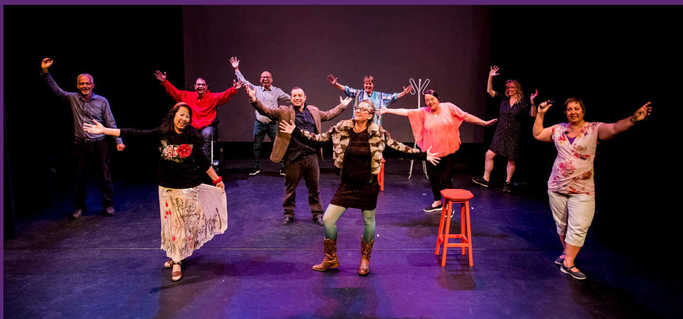
Beeld: De elf wijkbewoners én makers van de voorstelling Ongezien

Samen met Welzijn Rijswijk, de Rijswijkse Schouwburg, de Bibliotheek aan de Vliet en Museum Rijswijk ontwikkelden we diverse projecten, waarbij vraaggericht gewerkt werd. In de periode van zaterdag 3 t/m zaterdag 10 juli 2021 presenteerden wij deze pilot-activiteiten. Bekijk de aftermovie van Rijswijk in Verbinding . IV