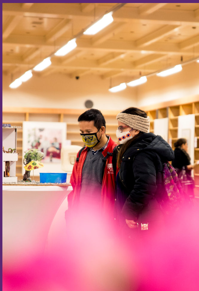
Beeld: Rijswijk Talent Award Pop Up Expo

IX Minimaal 13 Rijswijkse basisscholen werken aan duurzame verankering in het onderwijs, door deelname aan het landelijke programma Cultuureducatie met Kwaliteit (CMK). Er is samenhang met het kennismakingsprogramma. In het najaar van 2020 schrijft Trias als coördinator namens Rijswijk en Leidschen-dam-Voorburg een plan voor CMK-3 (2021-2024).