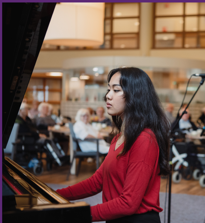
Beeld: Optreden van de Trias Talent Agency tijdens het project Rijswijk in Verbinding

De samenwerking met de Kracht van Rijswijk was ook in 2020-2021 nog steeds van kracht. Er waren vooral online bijeenkomsten met de directeuren van de Bibliotheek aan de Vliet, Rijswijkse Schouwburg, Museum Rijswijk, Stichting Welzijn en Trias. Samen met de bibliotheek en Stichting Welzijn heeft Trias een eerste concept nieuwe media plan geschreven dat later door de werkgroep StadsI@b is opgepakt. III Er was een sessie in de schouwburg met de wethouder over de corona regelingen van het Rijk en we gingen gezamenlijk met de wethouder naar het poppodium Paard in Den Haag omdat zij in coronatijd een aantrekkelijke livestream studio hadden ingericht. Samen met Museum Rijswijk en amateurpartners organiseerden wij de Rijswijk Talent Award, de 1e editie beeldende kunst en fotografie. Samen met de Bibliotheek is Trias uitvoerder van Cultuureducatie met Kwaliteit voor het basisonderwijs. Samen met Welzijn Rijswijk, de Rijswijkse Schouwburg en Museum Rijswijk organiseerden we in de lente en zomer 2021 activiteiten in het cultuurparticipatie-project Rijswijk in Verbinding.