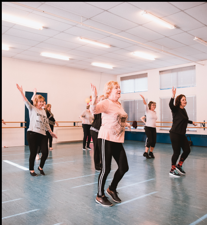
Beeld: Happy Dance les

Fit blijven door lichaamsbeweging is erg belangrijk. Door op een laagdrempelige manier in beweging te blijven tijdens de Happy Dance danslessen van Trias lukt dat. Proeflessaanvragen blijven binnen komen en steeds meer 55+ Rijswijkers weten de weg naar Trias te vinden. Trias voerde dit initiatief in 2020-2021 met steun van de gemeente Rijswijk uit met als doel om mensen te stimuleren om ook op latere leeftijd in beweging te blijven. Een neveneffect van de les blijkt dat mensen elkaar ontmoeten en na afloop met elkaar in gesprek gaan; de lessen zijn voor veel deelnemers een wekelijks uitje. Momenteel dansen wekelijks 36 dames bij Trias en het is goed om te vermelden dat het aantal deelnemers groeit. Door corona zijn de lessen online voortgezet op de woensdag en vrijdag. Daarmee hebben we enkele dames weten te bereiken. Vanwege de sterk opgebouwde community hebben de dames tijdelijk Happy Feet in het leven geroepen. Hierbij zijn de dames op het tijdstip van de happy dance les, twee aan twee gaan wandelen in de buurt, om zo toch in beweging te blijven en bovenal in contact te blijven staan met elkaar.