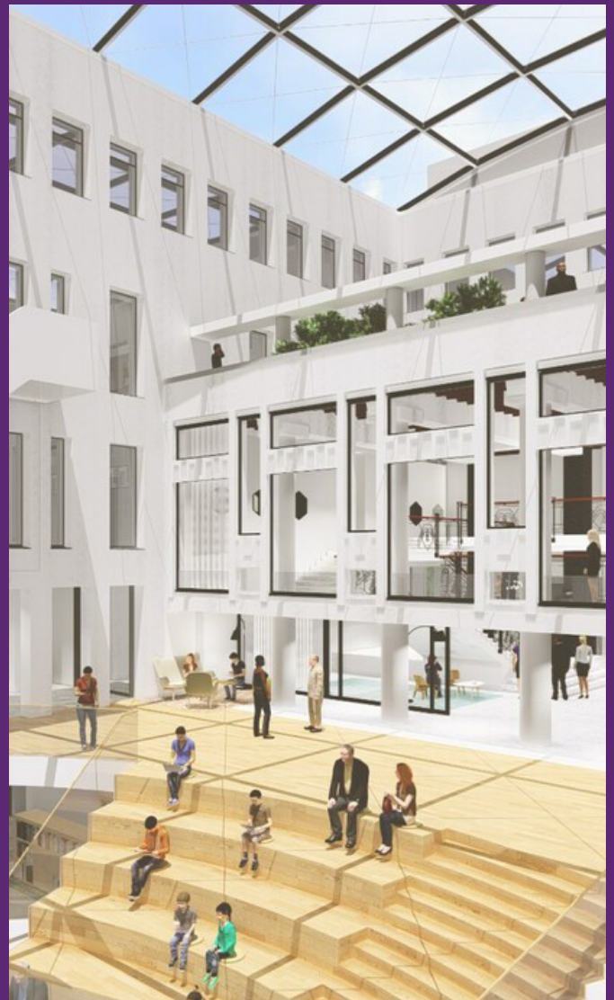
Impressiebeeld van het atrium in het Huis van de stad

Elke partner houdt zijn eigen bedrijfsvoering. Tegelijk gaan we samendoen wat samen kan. Dat allemaal om een optimale dienstverlening te verzorgen naar de bewoners en door de krachten te bundelen mogelijk kosten te besparen. Alhoewel dat laatste nog niet veel soelaas biedt. Trias heeft altijd een zuinige bedrijfsvoering geleid. Door samenwerking met de gemeente en bibliotheek worden wij naar een ander kostenniveau getrokken. De directeur zit in de bewonerscommissie met de inwonende organisaties. Daar vindt de regie plaats van alle organisatorische processen en van de werkgroepen. De beoogde verhuizing van Trias zal in de meivakantie 2022 plaatsvinden. 11